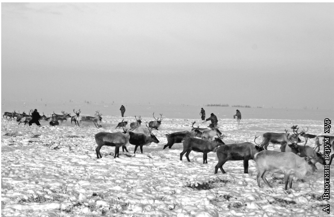
А. ВНОГДИН ВЕРУМ ХУР