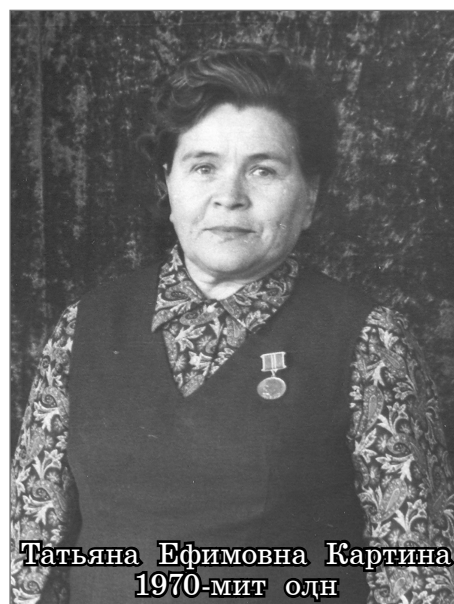
Татьяна Ефимовна Картина 1970-мит олн

Ма тәта вәндтылмәм пу-райн баяһаң арсыр сыйт юнт-сум, лүхн Ёмвошев сәңхумат