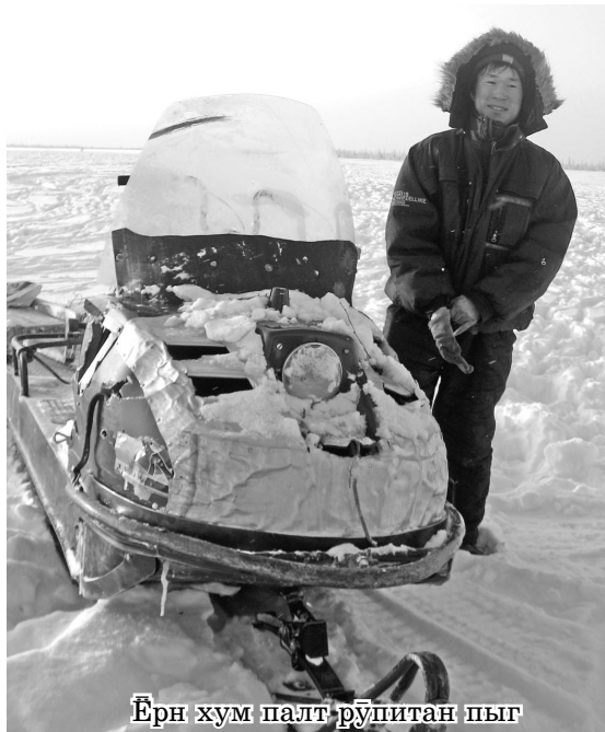
Ӓрн хум пәлт рупитан пыг