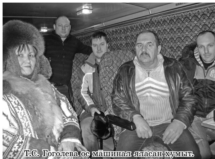
Т.С. Гоголева ос машинат яласан хумыт.

Хулумсунт миркол кўшайин щёпитаңкв лавыгласес. Тав шар нэматыр тот атыпыл вәрүм.