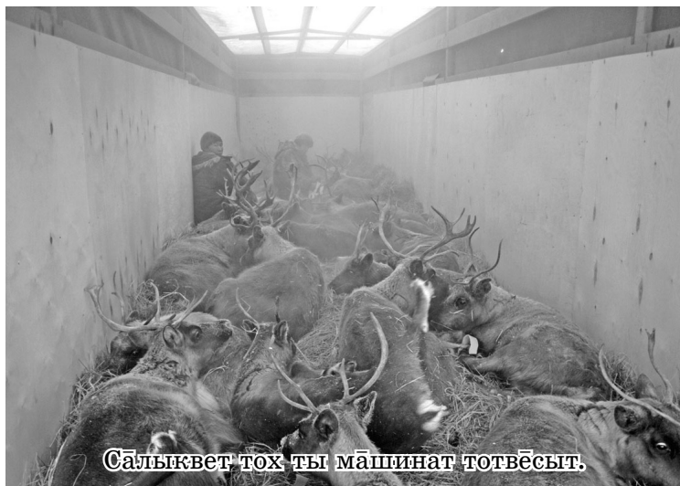
Салыквет тох ты машинат тотвёсыт.