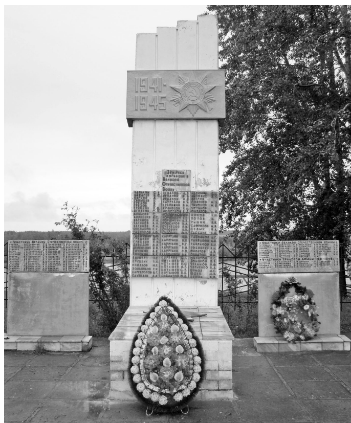
А. Хомяков омсум кев хурас