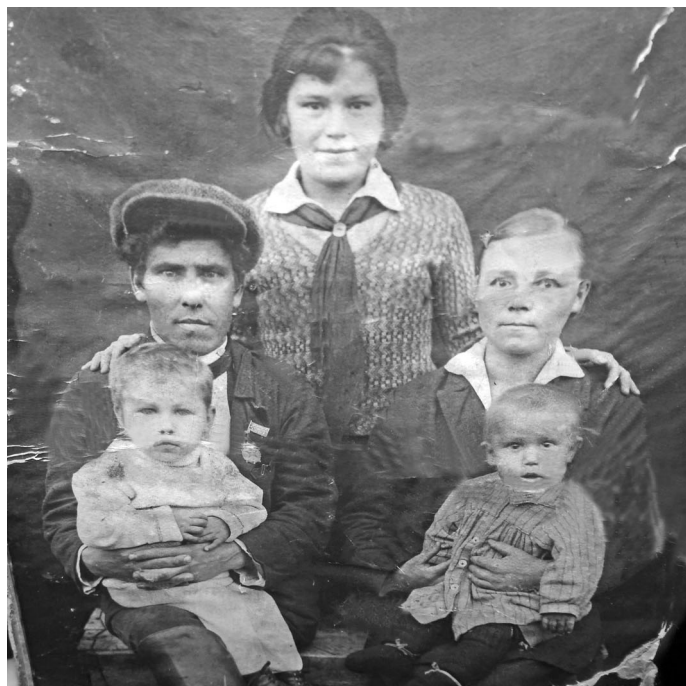
О.Ковалёва аңкел, ащел па апщәңәл пида