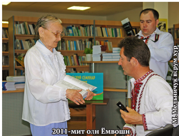
2011-мит олн Ёмвошн

Евдокия Ивановна әшкола пурайд яма нәмләл. И хәтл кәт рўш икенәң юхәтсәңән па дын кўтәнән ән вәты ясәңән путәртсәңән, дын непекәң хуятңән вәлман. Ши эвәлт ай эвие әшколая тәты юхәтман. Вәндтәйлдты тәхел хўвн па нявремәт интерната павәтсыйт. Әңки-аши па ай ампиел тәкды шеңк мәрәм вәс. Әхәт лўнәтты, хәншты вәндәс па пид әхәл пидә юнтман па няхман хәхәтләс. Оләңән лўвәда буквайт вантассәт вўды хота, хумәлхая, ләнт сапла, вой пәнәта. Эвие яма хәншәс па нявремәт вәндтәты неңа ювмәл юпийн Хошлог кәрта юхды керләс. Айлат не әшколайн кәшәя павәтсы па эвиет па пухийет хәншты